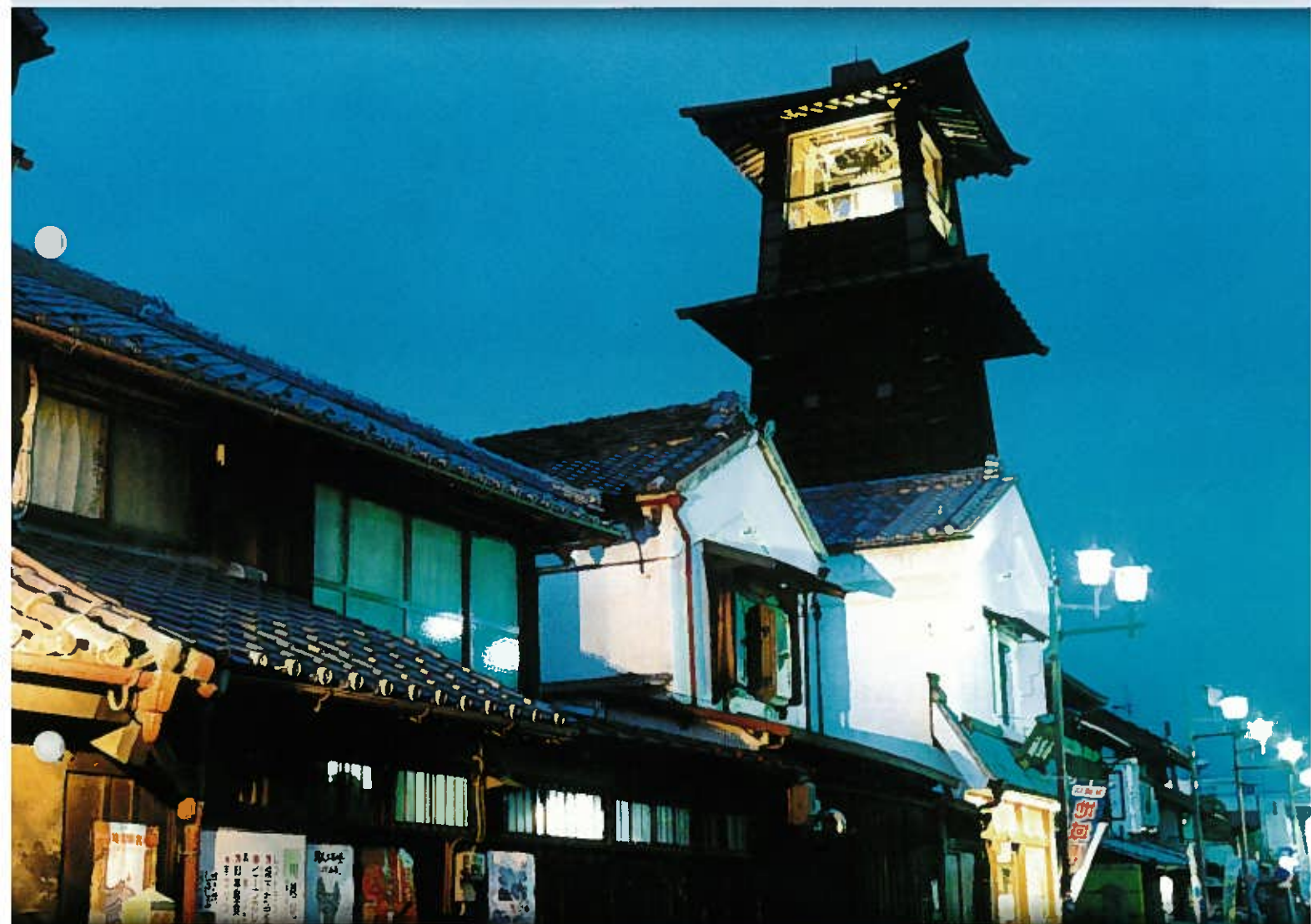
「宵の『時の鐘』」(川越市)