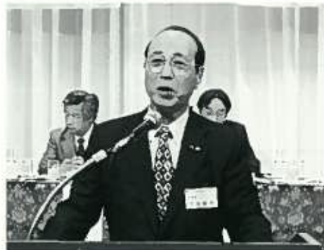
提案説明 三城幹事長