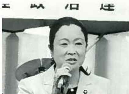
土屋品子 衆院議員