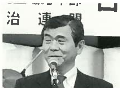
金子善次郎 国交大臣政務官