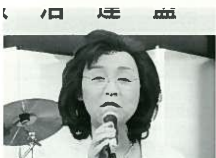
中森ふくよ 衆院議員