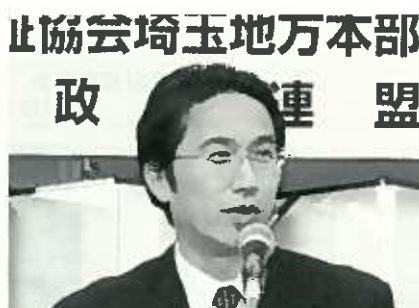
新井悦二 衆院議員