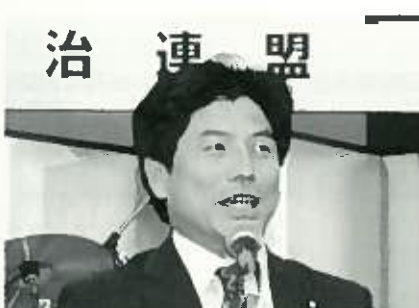
中根一幸 衆院議員