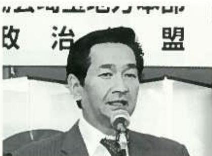
関口昌一 参院議員