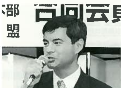
柴山昌彦 衆院議員