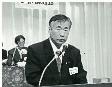
提案説明 芝間委員長