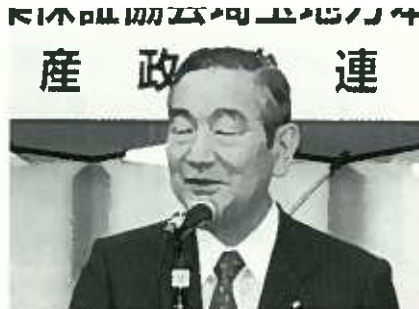
相川宗一 さいたま市長