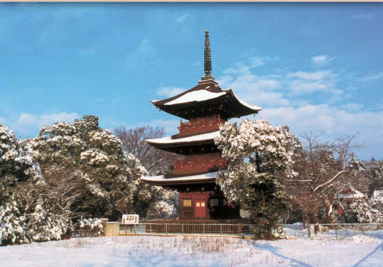
「淡雪の西福寺三重塔」(川口市)