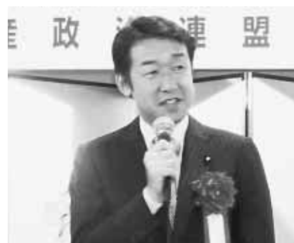
田中良正 衆議院議員