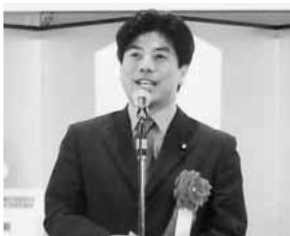
中根一幸 衆議院議員