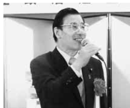
早川忠孝 法務大臣政務官