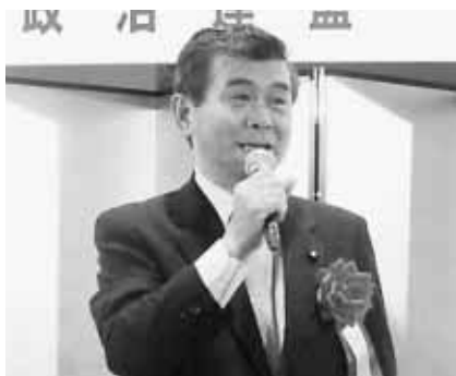
金子善次郎 厚生労働大臣政務官