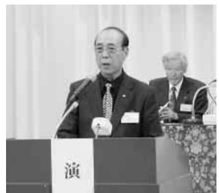
提案説明 三城幹事長