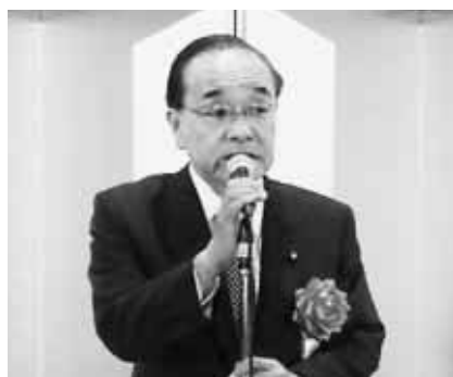
中野清 衆議院議員