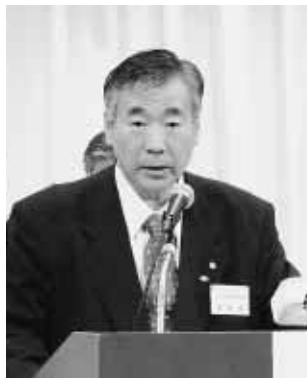
提案説明 芝間総務財務委員長