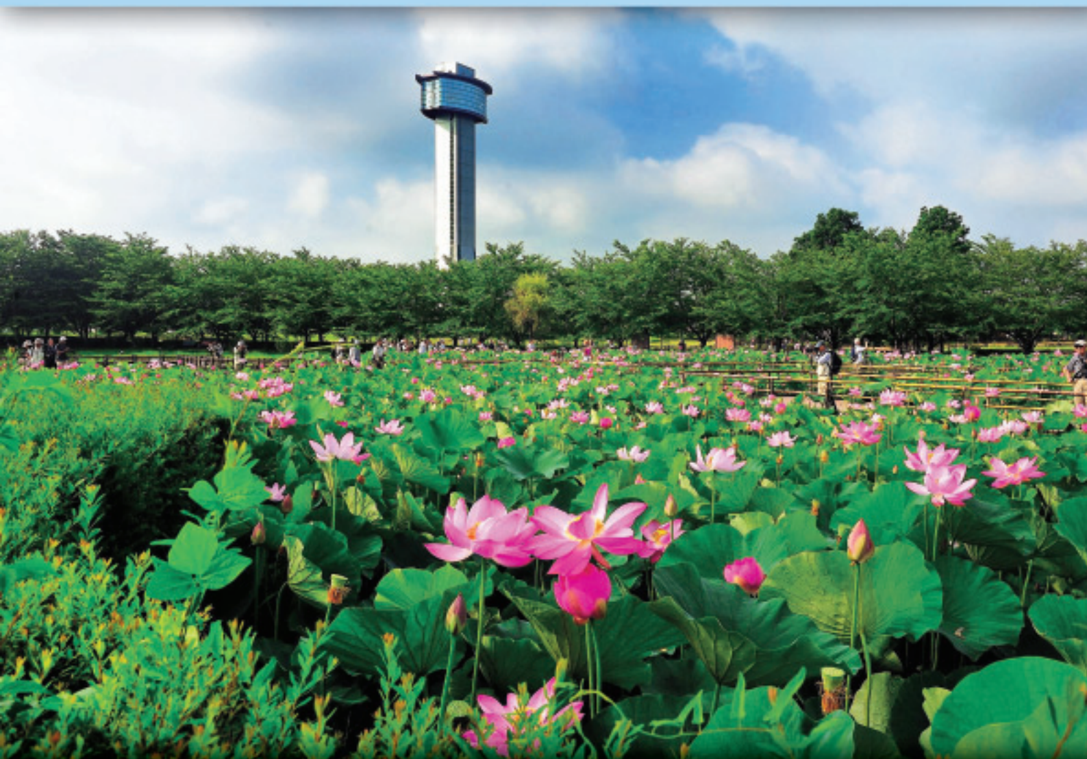
古代ハス(行田市古代蓮の里) 堀乃内 稔