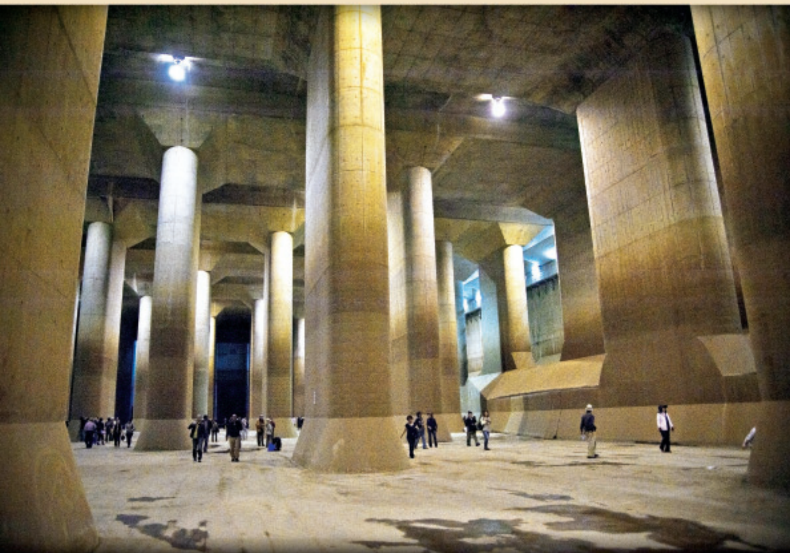
地下神殿（春日部市）