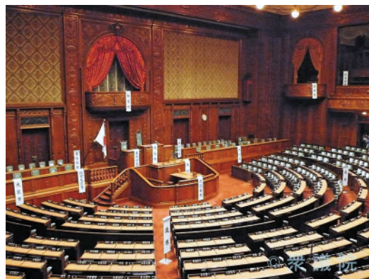
衆議院 HP より転載